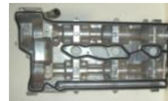
Cam Cover Gaskets